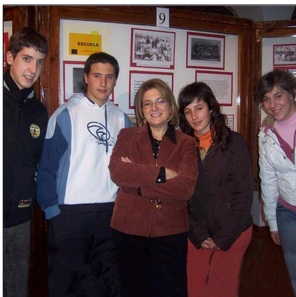
Alumnos del I.E.S. Herminio Almendros visitando la exposición "Cuéntame cómo pasó"

R: Sí, sí que me gustaría continuar, aunque supone una dedicación de muchas horas y mucho esfuerzo, pero sí que me gustaría continuar trabajando haciendo algo muy parecido. Creo que si pudiéramos repetir algo similar yo me daría por contenta. No creo que pueda tener mejor recompensa que la que he logrado con este trabajo. Sería estupendo que tuviera una difusión mayor, pero ya no dentro de nuestro entorno local, sino que fuera tomado como ejemplo en otros centros de la provincia o de la comarca, y que se pusiera en marcha una experiencia similar en otros lugares.